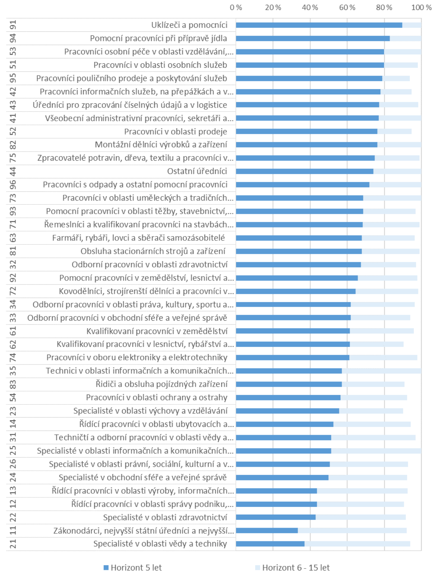
Obr. 3: Potenciál pro nahrazení sensorických, kognitivních, jazykových, sociálních a emočních dovedností v éře generativní AI (model 2024)